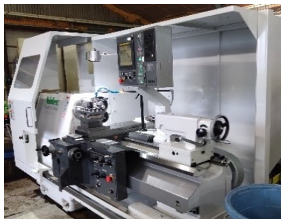
新設備 TAKISAWA TAC-510-L10