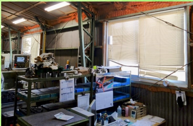
第2工場の窓を遮熱塗料で塗装し断熱効果で夏の暑さ対策を行いました